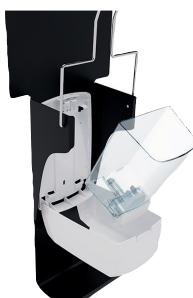
Réservoir transparent pompe anti-gouttes