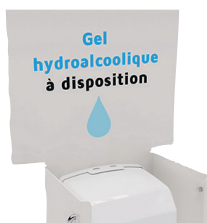
Plaque signalétique neutre (personnalisable en option)