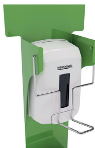
Barre de pression qualité premium