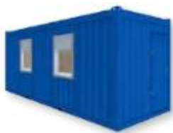
Modèle BM 20'